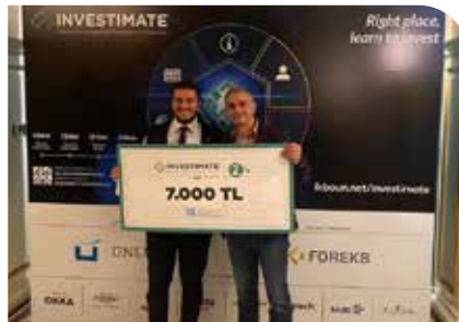
Nazilli İİBF öğrencileri Borsa Yarışmasını başarıyla tamamladı