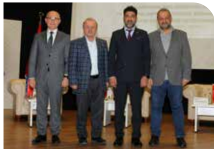
Şiddetle Sivil Mücadele ve Sosyal Arabuluculuk Paneli gerçekleşti