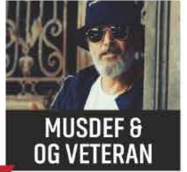
MUSDEF 6 OG VETERAN