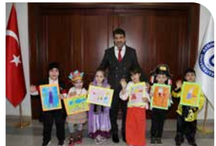
Minikler Rektörümüzü ziyaret etti