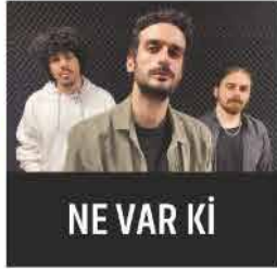
NE VAR Kİ