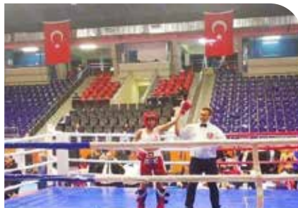
Şampiyonların Okulu, yine madalya ile döndü