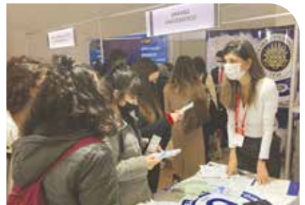
Üniversitemiz İzmir'de öğrencilerle buluştu