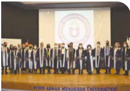
Akademik Yükseltme Töreni gerçekleşti