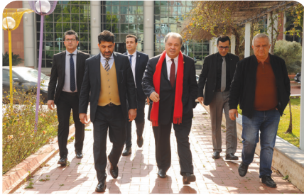
Üniversitemizde hukuk, siyaset ve sanat konuşuldu