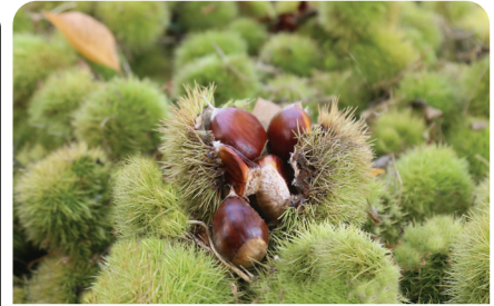
Aydın kestane üretiminde lider