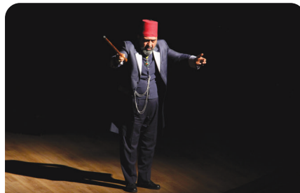
Usta Üniversitemizde sahnelendi