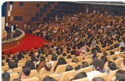
Üniversitemiz afete hazırlanıyor