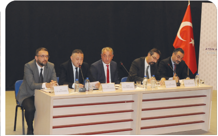
Üniversitemizde Cumhuriyet'in Beş Ciheti paneli düzenlendi