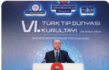
Rektörümüz Türk Tıp Dünyası Kurultayı'na katıldı