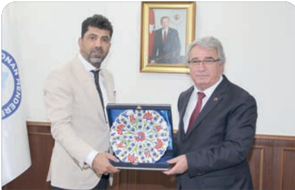
ADÜ GIDA, Aydın'ın Torku'su olacak