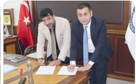
ADÜ - Ekonomi Kulübü Arasında İş Birliği Protokolü imzalandı