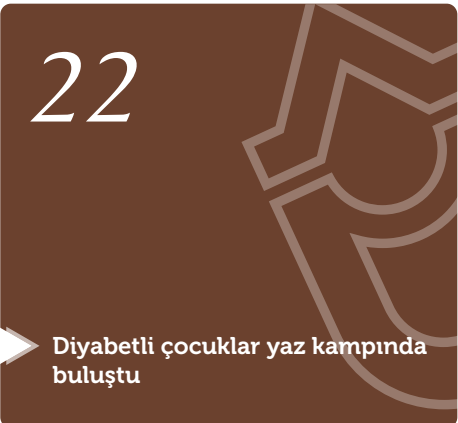
Diyabetli çocuklar yaz kampında buluştu