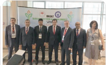
Hasat Uluslararası Tarım ve Orman Kongresi gerçekleşti