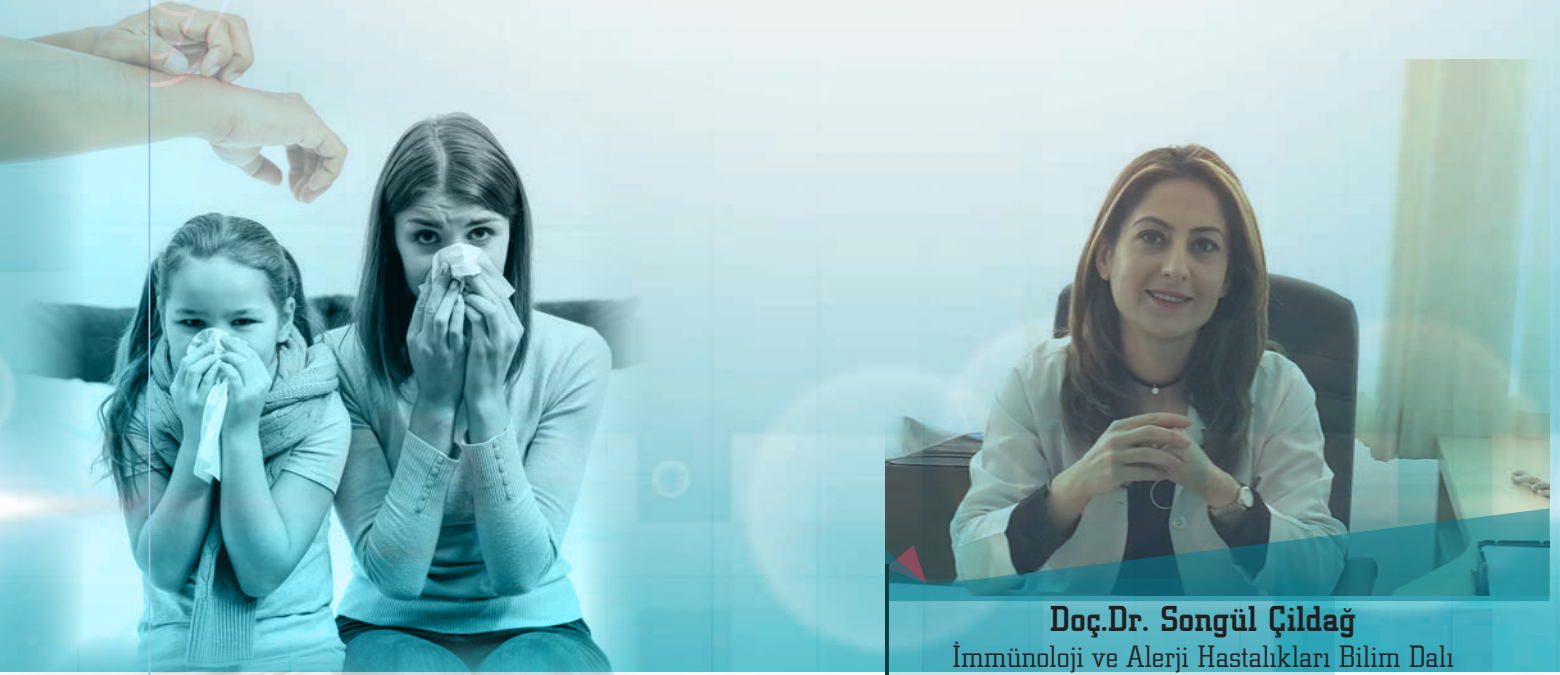
Doç.Dr. Songül Çildağ İmmünoloji ve Alerji Hastalıkları Bilim Dalı