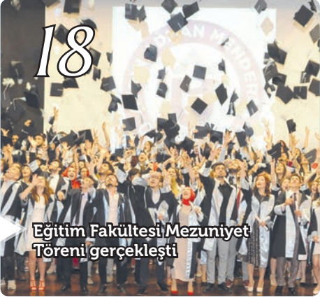
Eğitim Fakültesi Mezuniyet Töreni gerçekleşti