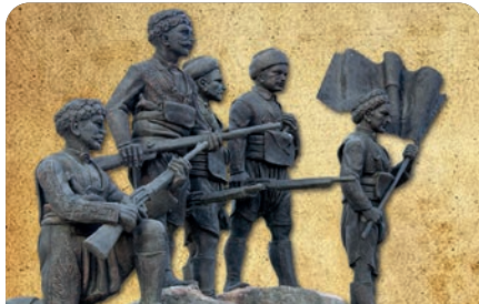
"Malgaç Baskını şanlı bir yolun ilk adımdır"