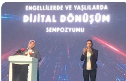
ADÜ Teknokent üçüncülük ödülüne layık görüldü