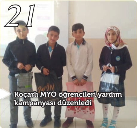
Koçarlı MYO öğrencileri yardım kampanyası düzenledi