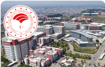
ADÜ Tarım ve Orman Bakanlığının Pilot Üniversitesi oldu