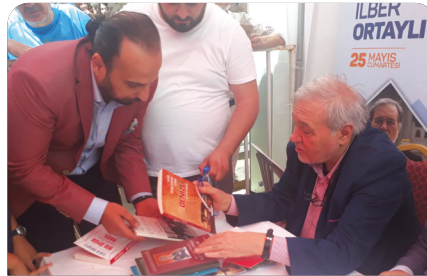
Kitap Fuarına ilgi yoğundu