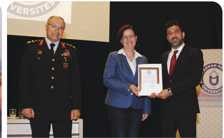
Üniversitemizde "Pontus Meselesi" ele alındı