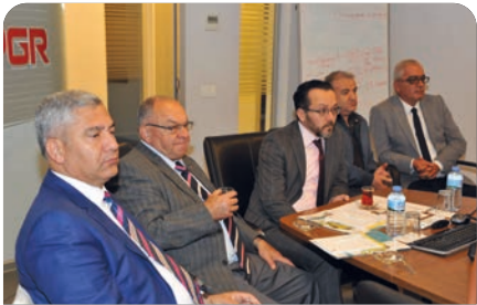
Pilot Tesis Proje Tanıtım Toplantısı gerçekleşti