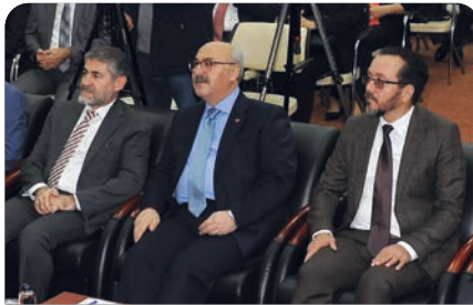
Rektörümüz iş dünyası toplantısına katıldı