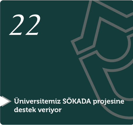
Üniversitemiz SÖKADA projesine destek veriyor