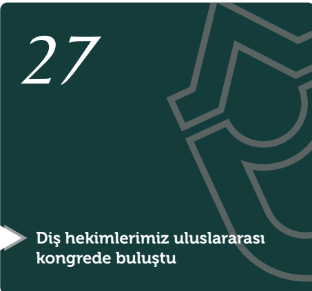
Dış hekimlerimiz uluslararası kongrede buluştu