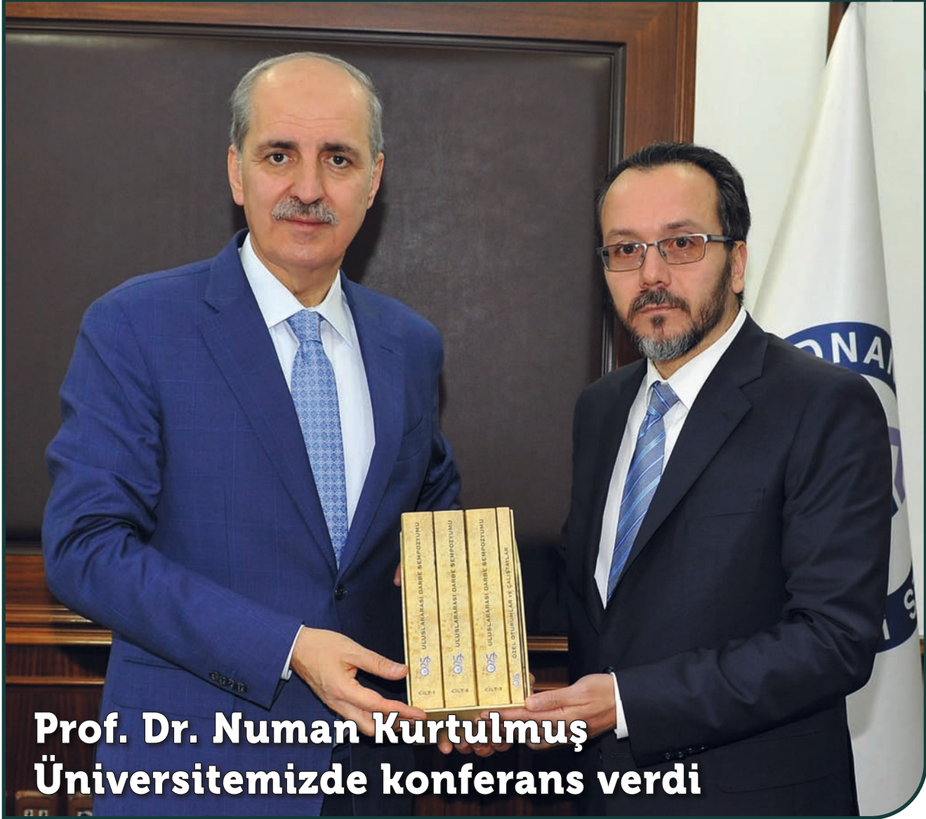
Prof. Dr. Numan Kurtulmuş Üniversitemizde konferans verdi

Yıl: 23 • Sayı: 134 • KASIM 2018 • ISSN: 1301-5575 • Aydın Adnan Menderes Üniversitesi Akademik Haber Dergisi