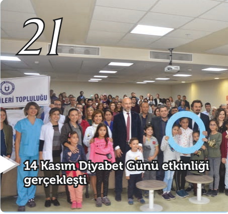
14 Kasım Diyabet Günü etkinliği gerçekleşti