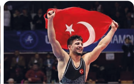
Dünya U 23 Güreş Şampiyonası'na ADÜ damgasını vurdu