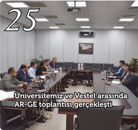
Üniversitemiz ve Vestel arasında AR-GE toplantısı gerçekleşti