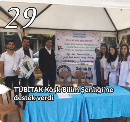
TÜBİTAK Köşk Bilim Şenliği'ne destek verdi