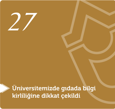
Üniversitemizde gıdada bilgi kirliliğine dikkat çekildi