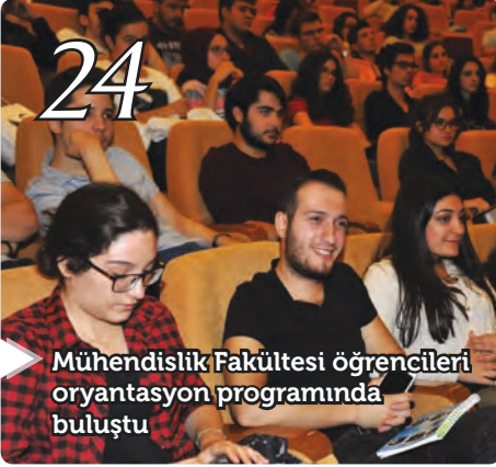
Mühendislik Fakültesi öğrencileri oryantasyon programında buluştu