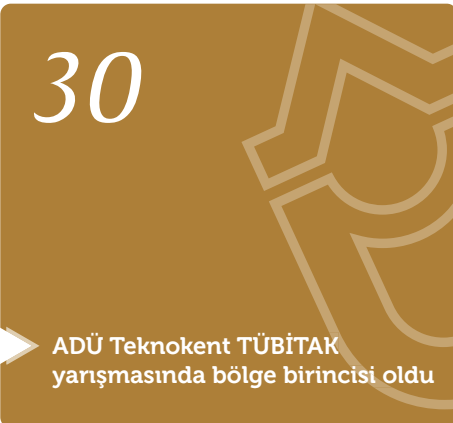
ADÜ Teknokent TÜBİTAK yarışmasında bölge birincisi oldu