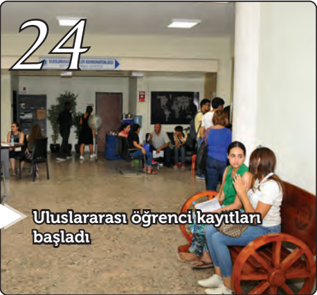
Uluslararası öğrenci kayıtları başladı