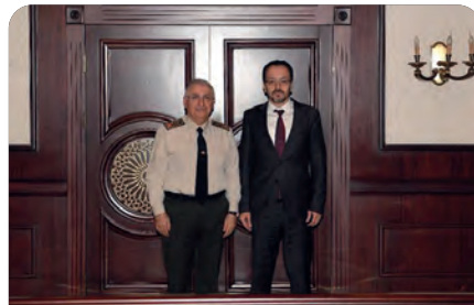
Rektörümüz Genelkurmay Başkanını ziyaret etti