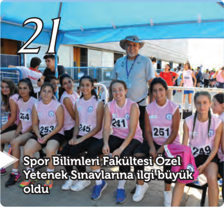
Spor Bilimleri Fakültesi Özel Yetenek Sınavlarına ilgi büyük oldu