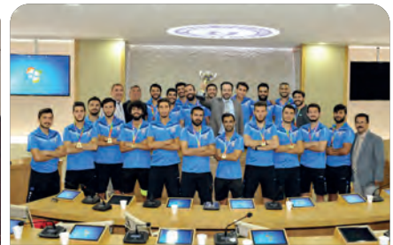
Üniversitemizi gururlandıran birincilik