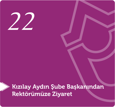
Kızılay Aydın Şube Başkanından Rektörümüze Ziyaret