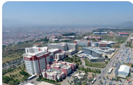
Üniversitelilerin tercihi Aydın oldu