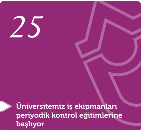
Üniversitemiz iş ekipmanları periyodik kontrol eğitimlerine başlıyor