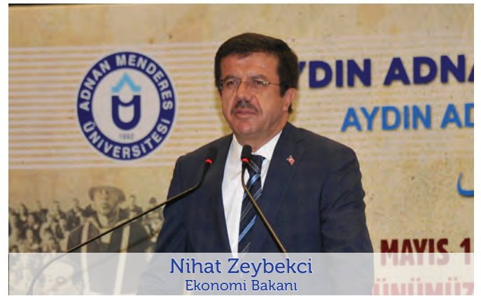
Nihat Zeybekci Ekonomi Bakanı