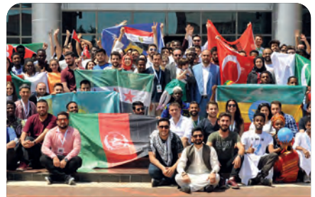
Üniversitemizde 11. Uluslararası Öğrenci Buluşması gerçekleşti