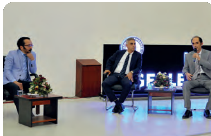
"Kendi Değerlerimiz"de ekonomik konuşuldu