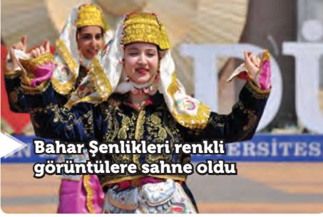
Bahar Şenlikleri renkli görüntülere sahne oldu