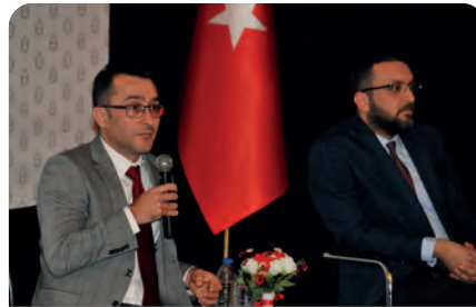
Üniversitemizde "Geçmişten Günümüze Balkanlarda Barış Arayışı" paneli düzenlendi