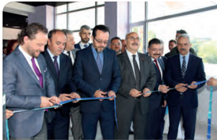
"International Dent Care" Diş Polikliniğinin açılışı gerçekleşti