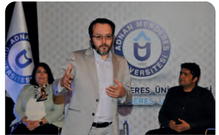
Kendi Değerlerimizle "Geleneksel ve Tamamlayıcı Tıp'ı" konuştuk