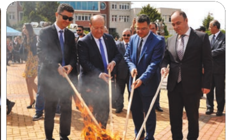
Baharın müjdecisi Nevruz Üniversitemizde kutlandı