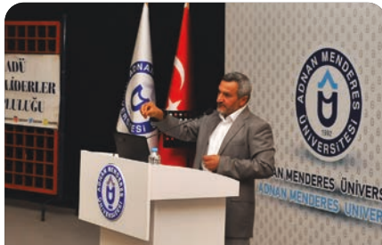
"Kurtlar Sofrasında Çanakkale" konulu konferans düzenlendi