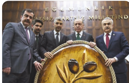
Üniversitemizden Cumhurbaşkanımıza anlamlı hediye