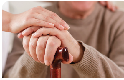
Adnan Menderes Üniversitesinde Tazelenme Üniversitesi kuruluyor