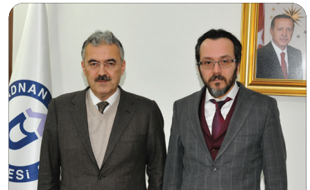
İzmir Valisi Erol Ayyıldız'dan Rektörümüze taziye ziyareti