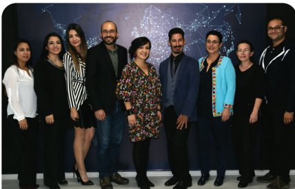
Değişim programları tek çatı altında toplandı