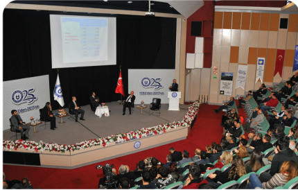
Üniversitemizde Tarımsal Öğretim 172. yılı kutlandı