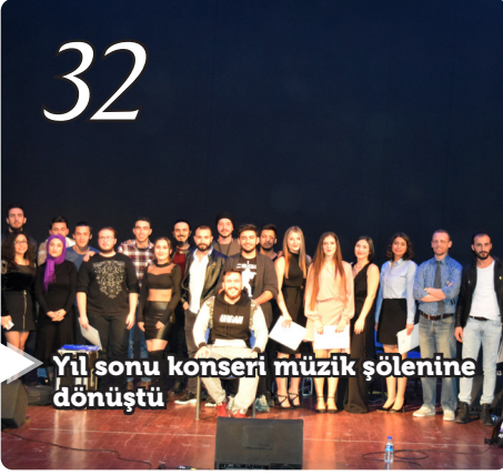
Yıl sonu konseri müzik şölenine dönüştü