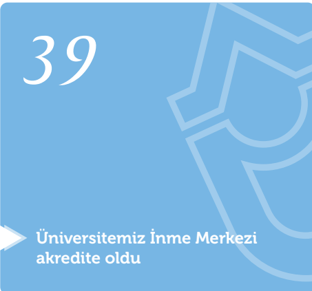
Üniversitemiz İnme Merkezi akredite oldu