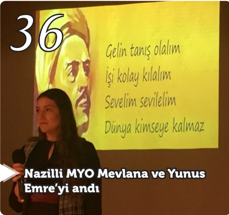
Nazilli MYO Mevlana ve Yunus Emre'yi andı