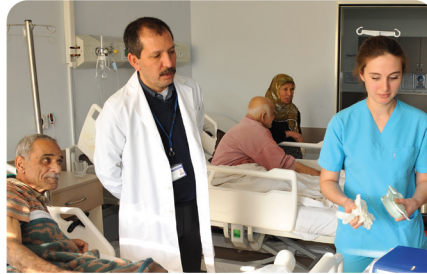
Yara Bakım Ünitemiz TRT Haber'de