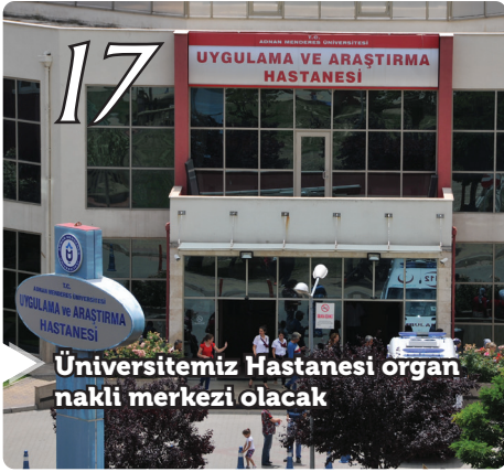
Üniversitemiz Hastanesi organ nakli merkezi olacak