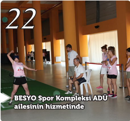
BESYO Spor Kompleksi ADÜ ailesinin hizmetinde

Üniversitemizden İlimize Bir Kültür Hediyesi ADÜ KİTAP FUARI