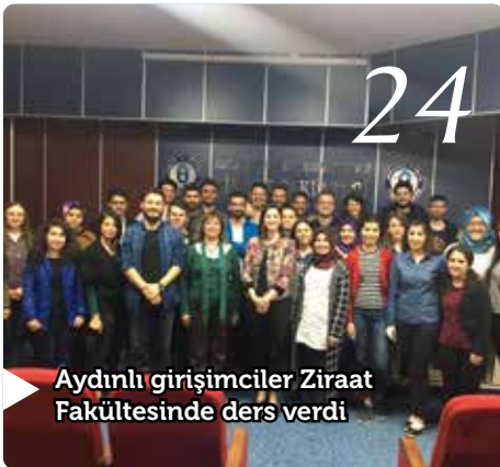
Aydınlı girişimciler Ziraat Fakültesinde ders verdi