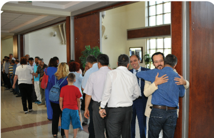
Üniversitemizde Geleneksel Bayramlaşma Töreni yapıldı