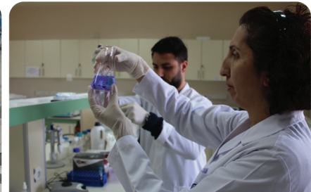
Üniversitemizden milli mamaya tam destek