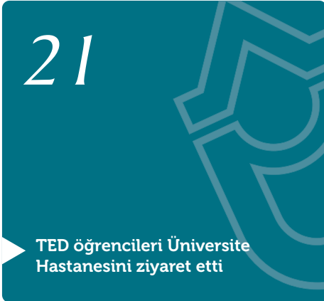
TED öğrencileri Üniversite Hastanesini ziyaret etti