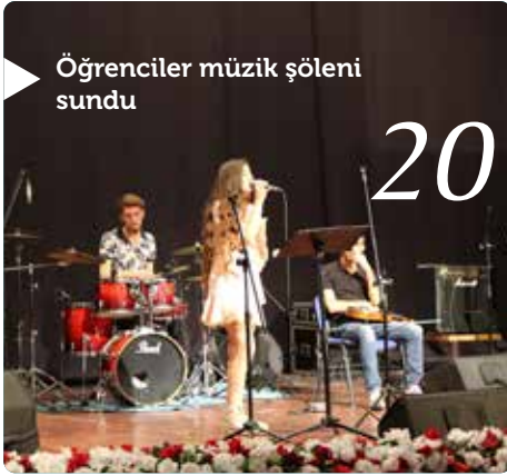
Öğrenciler müzik şöleni sundu