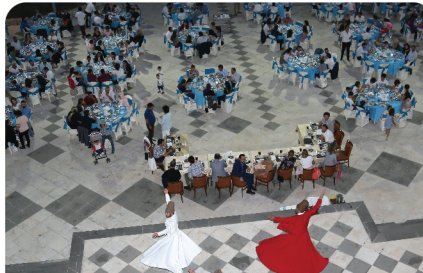
Üniversitemizde iftar yemekleri verildi