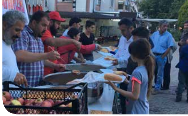
Ramazan boyunca 15 gün Hizmet Binası önünde verilen iftar yemeklerinden 15 gün Davutlar Belediye herkes faydalanabildi.