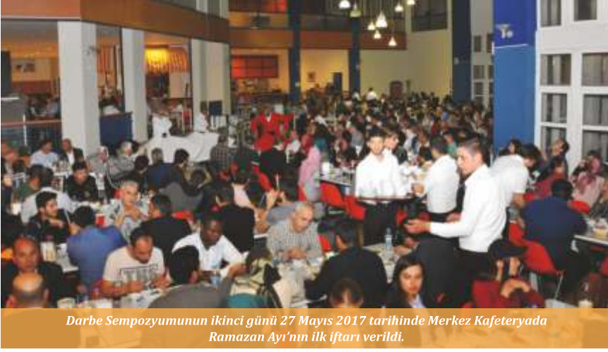
Darbe Sempozyumunun ikinci günü 27 Mayıs 2017 tarihinde Merkez Kafeteryada Ramazan Ayı'nın ilk iftarı verildi.

mahkeme sonunda henüz 15 yaşındayken idama mahkum edildim. Amaçları imam hatipler üzerinden halkın üzerinde korku salmaktı. Bu hadiseler yaşandıktan sonra imam hatibe gidenlerin sayısı yarı yarıya düştü. 11 yıl hapis yattım. Bedeller ödedik ama 15 Temmuz'da da olduğu gibi demokrasi ve hürriyetimiz sahip çıktık. Artık Türkiye ümmetin ve mazlumların güvenilir tek limanı haline geldi. Birileri bu güvenilir limana zarar vermek istiyor. Bizim el ele verip bu limanı korumamız lazım. Allah Türkiye'nin ve Türk milletinin yardımcısı olsun." şeklinde konuştu.