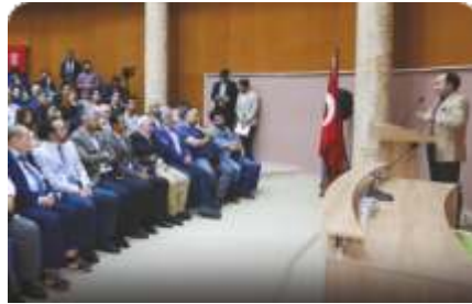
Diriliş Konferansları devam ediyor