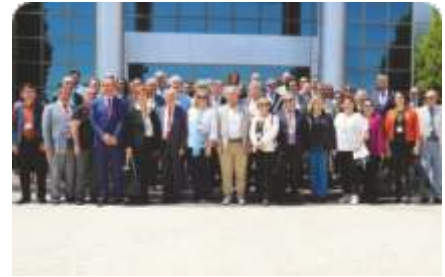
İletişim fakültesi dekanları Üniversitemizde buluştu