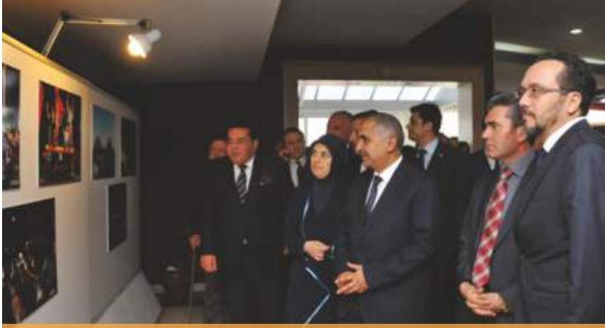
Sempozyumda "Demokrasiye Adanmış Bir Ömür Adnan Menderes Fotoğraf Sergisi" ve "Anadolu Ajansı 15 Temmuz Fotoğraf Sergisi"nin açılışı yapıldı.