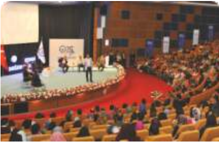
"Kendi Değerlerimiz"de insan yetiştirme politikalarını konuştuk