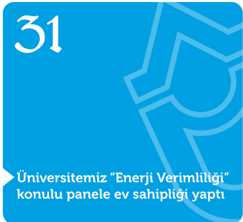
Üniversitemiz "Enerji Verimliliği" konulu panele ev sahipliği yaptı