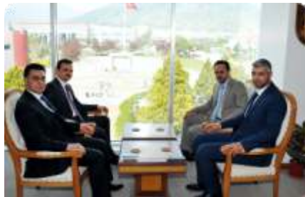
Cumhurbaşkanlığı Halkla İlişkiler Başkanı Üniversitemizdeydi