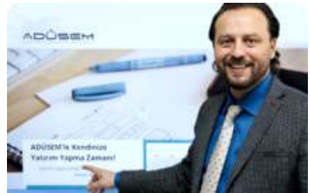
Yenilenen yüzüyle ADÜSEM eğitim alanında vitrin olmaya hazırlanıyor