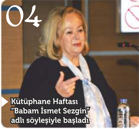
Kütüphane Haftası "Babam İsmet Sezgin" adlı söyleşiyle başladı