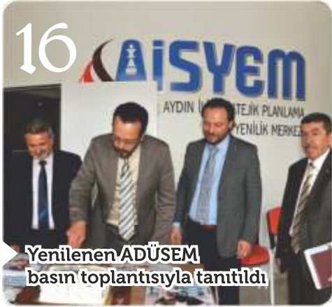
Yenilenen ADÜSEM basın toplantısıyla tanıtıldı