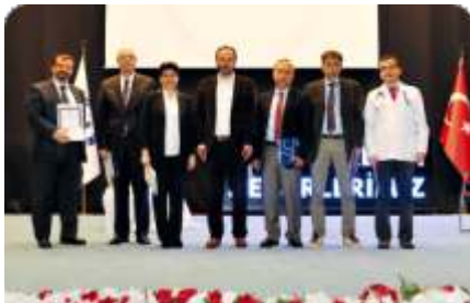
"Kendi Değerlerimiz" çağın vebası kanseri masaya yatırdı