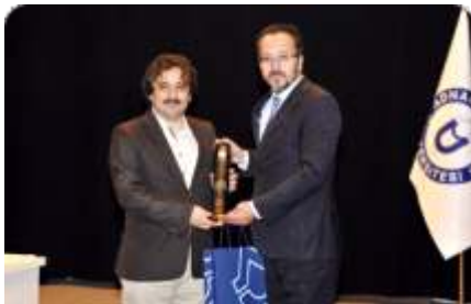
"Yeni Anayasa ve Cumhurbaşkanlığı Sistemi" masaya yatırıldı