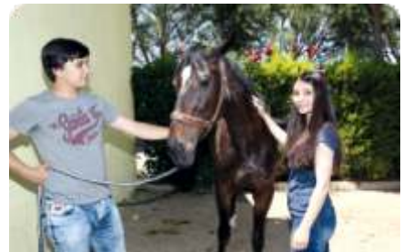
Üniversitemiz öğrencilerini hayvan sevgisi ile yetiştiriyor