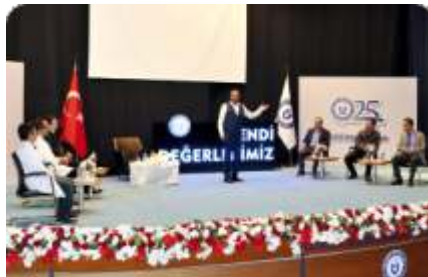
Kendi Değerlerimiz "Tarih" ve "Sağlık" konu başlıklarıyla gerçekleşti