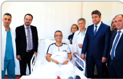
Aydın Milletvekili Bülent Tezcan'dan ADÜ'ye teşekkür