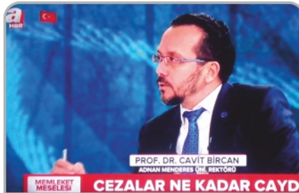
Rektörümüz A Haber'de gündemi değerlendirdi