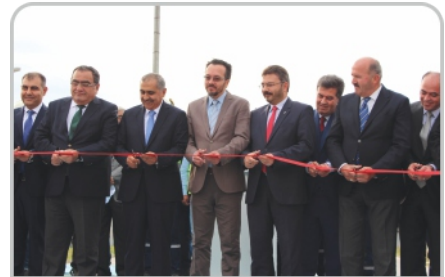
Rektörümüz Pamukören Jeotermal Santrali'nin açılışına katıldı