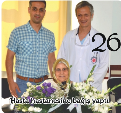
26 Hasta hastanesine bağış yaptı