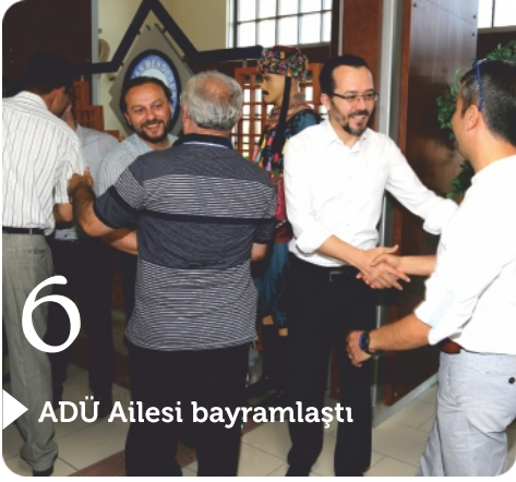
ADÜ Ailesi bayramlaştı