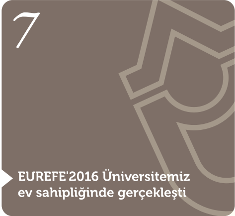
EUREFE'2016 Üniversitemiz ev sahipliğinde gerçekleşti