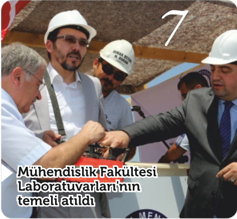
Mühendislik Fakültesi Laboratuvarlarının temeli atıldı