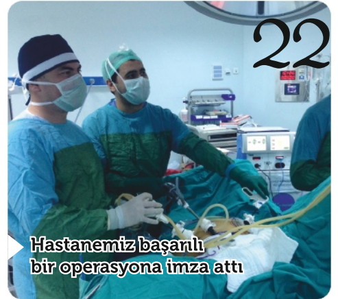
22 Hastanemiz başarılı bir operasyona imza attı

Veteriner Fakültesi Ek Bina Temel Atma Töreni gerçekleşti