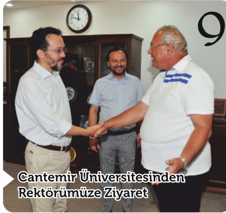
9 Cantemir Üniversitesinden Rektörümüze Ziyaret

İÇİNDEKİLER İÇİNDEKİLER İÇİNDEKİLER İÇİNDEKİLER İÇİNDEKİLER