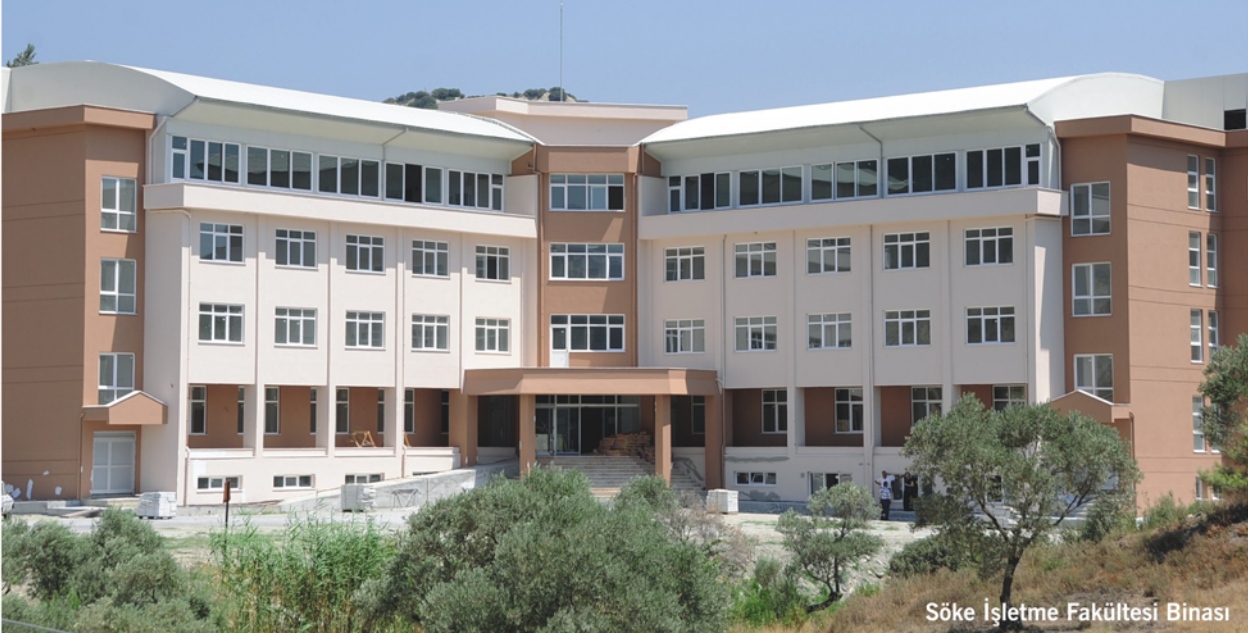
Söke İşletme Fakültesi Binası

— Bizim turizm, iktisat ve sağlık konusunda öğrenci yetiştiren çok iyi fakülte ve meslek yüksekokullarımız var ve biz, bu bölüm ve programları açarken onlarla birebir görüşerek, fikir alışverişi yaparak hareket ettik. Söke ilçesi, Didim, Kuşadası ve Davutlar'a yakınlığı nedeniyle turizmin adeta kalbidir. Bu nedenle burada turizm eğitimi vermeden eğitim rolümüzü tam olarak yerine getirmiş olmayız diye düşündük. Ayrıca