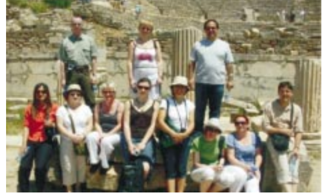
Erasmus konukları Efes ve Kuşadası'na yapılan gezide