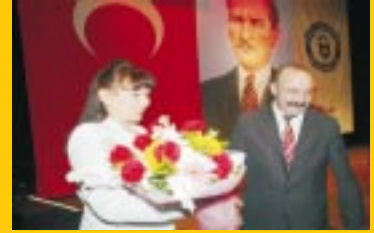
▶ Oda müziği orkestrası ADÜ'deydi