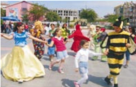
▶ ADÜ de çocuk şenliği yapıldı