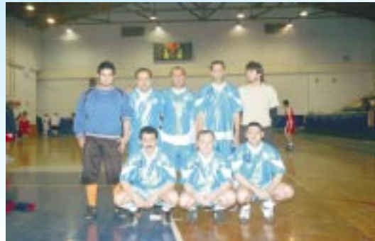
▶ Çine Futsal Takımı şampiyon oldu