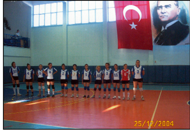
Bir müsabaka öncesi Voleybol takımımız seremonide

Bu sonuçlar sonunda 12 puan toplayan takımımız grup birincisi, Sakarya Üniversitesi ikinci, Onsekizmart Üniversitesi üçüncü olmuştur.