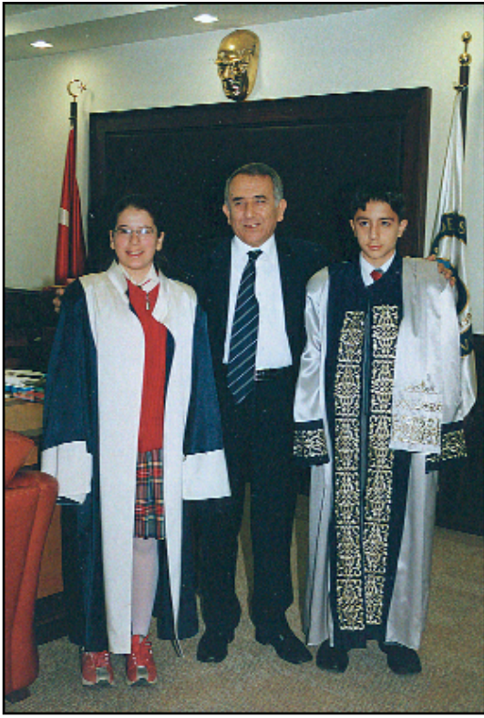
H. Kerem BOZYAKIT Haber Merkezi

23 Nisan Ulusal Egemenlik ve Çocuk Bayramı tüm yurttan olduğu gibi Aydın'da da çeşitli etkinliklerle kutlandı.