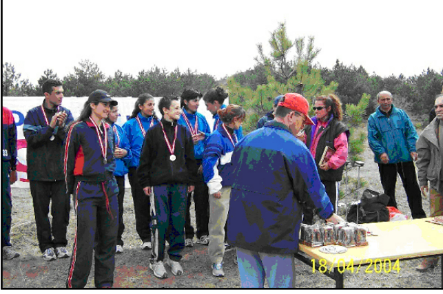
Takımlar ödül töreninden sonra toplu halde fotoğraf çektiler