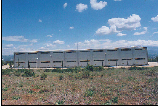
Ör.Gör. Hakan ÖZLHAN Karacasu Meslek Yüksekokulu

Baflbakanlık Özelleştirme <daresi Baflkanlık na baEl> olan ve atıl durumda bulunan Karacasu Tekel Deposu, Maliye Bakanlık ve Tekel Yaprak ve Tütün <flletmeleri aras>nda yapılacak olan protokol ile Üniversitemize kesin devir iflemi önümüzdeki günlerde gerçekleşecektir. Üniversitemize devredilen ve depo olarak kullanılmıflı gayri menkul, yaklaşık 3000 m 2 kapalı, 12.000 m 2 açık alan olmak üzere toplam 15.000 m 2 alana sahiptir. Devredilen alan bahçe duvarlı, içinde idare ve depo binası bulunan korunaklı bir alandır. Devrin gerçekleştirilmesinden sonra kapalı 3000m 2 lik alan gerekli atölye, derslik, akademik ve idari bölümlere ayrılarak yeniden düzenlenecektir; böylece daEl>nk durumda bulunan derslik ve atölyelerin tek bir alanda toplanması saElanacaktır Bunun yanında fiziki imkanların artmasıyla daha sonraki yıllarda Meslek Yüksekokulumuza Turizm, Mermercilik ve <flletmecilik gibi yeni programların açılması mümkün olacaktır. Yakın zamanda açılması düflünülen programların eElitime bafllamasıyla program sayısının 7'ye, öğrenci sayısının ise 500'e çıkması hedeflenmektedir.