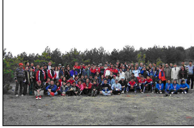
2. olan Bayan takımımız ödül töreninde.

Okt.faheser GÜREfi Beden Eğitimi Spor Y.O.