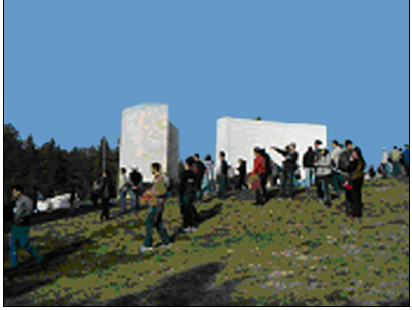
Conkbayır şehitleri Anıtı

Çanakkale'ye girişte yine askeri tören ile karşılanan katılımcılar, limanda hazır bekletilen otobüsler ile Çanakkale Savaşları'nın yapıldığı toprakları görmek üzere yola çıktılar. Gezi programı dahilinde 17 Mart günü; Çanakkale şehitleri Anıtı, 57. Alay şehitliği ve Anıtı, Conkbayır Anıtları, Mehmet Çavuş Anıtı, Onbaşı Seyit Anıtı, Yahya Çavuş şehitlik ve Anıtı, Deniz Müzesi, Kabatepe Müzesi, Arburnu, Kilitbahir ve Seddülbahir gezilmiştir. 18 Mart günü "Çanakkale Deniz Zaferi Etkinlikleri" ne katılan öğrenci ve öğretim üyeleri, aynı gün öğleden sonra Çimenlik Kalesini ve kale içinde yer alan Nusret Mayın Gemisi'ni, Piri Reis Müzesini gezmişlerdir. 18 Mart günü 24'de "TCG «S-kenderun» adlı gemi ile tekrar İzmir Limanı'na dönüşü yola çıkan katılımcılar gece boyunca gemi içinde yapılan etkinliklerle duygu ve düşüncelerini dile getirmişler, milli ve manevi duyguların gelişmesi, Türkiye Cumhuriyeti'nin ne zor şartlarda kurulduğunun anlaşılması için, 205.300 Türk şehit ve 252.000 yabancı'nın katıldığı bu toprakları her Türk vatandaşın ziyaret etmelidir.