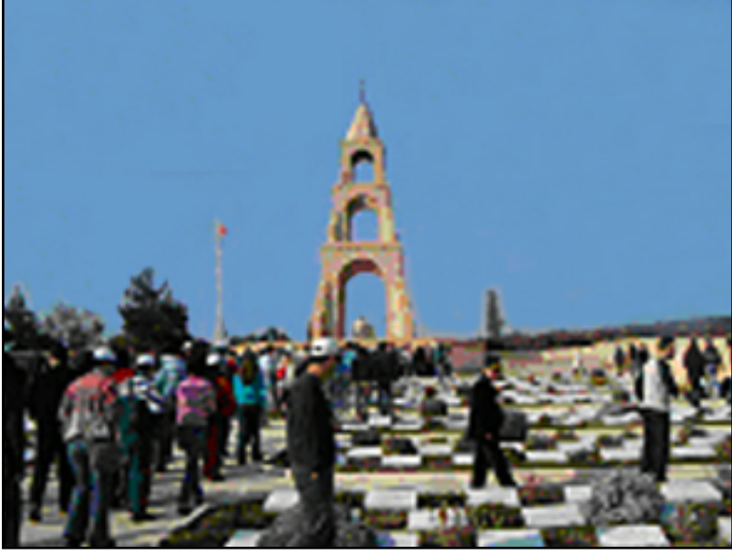
Çanakkale şehitleri Anıtı