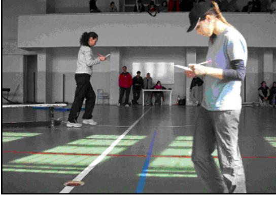
Salon oryantiring yarışmasında bir görüntü

Beden Eğitimi ve Spor Yüksekokulu etkinliklerinden biri olan Salon Yarışması 25 Ocak 2004 tarihinde okulun spor salonunda yapıldı. Yarışmayı, Üniversitemizin oryantiring takımı antrenörleri Okt. Fahreser GÜREfi, Okt. Nermin fiENTÜRK ve Okt. Vedat fiENTÜRK düzenlemişlerdir. Yapılan yarışma sonucunda ilk üç dereceyi alan yarışmacılar aşağıdadır: