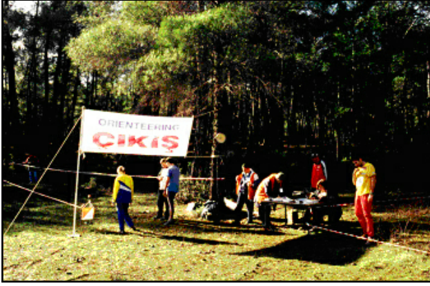
Oryantiring Okul takımı Bolu'da yarışma öncesi

Okulumuz oryantiring takımı iki yıldan bu yana üniversiteler arası oryantiring yarışmalarına katılmaktadır. Üniversitemiz bayan oryantiring takımının bu spor dalında henüz çok yeni olmasına rağmen, büyük bir başarı göstererek 2003 yılında Bolu'da yapılan yarışmada Türkiye üçüncüsü olması, takımın gelecek için iddialı olduğunu göstermiştir.