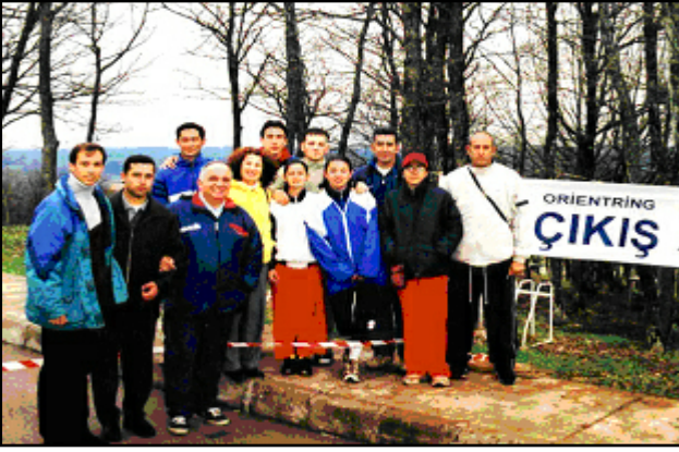
Oryantiring yarışmasında çıkış bölgesi