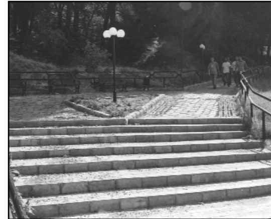
Yaya Yolunun Yeni Hali