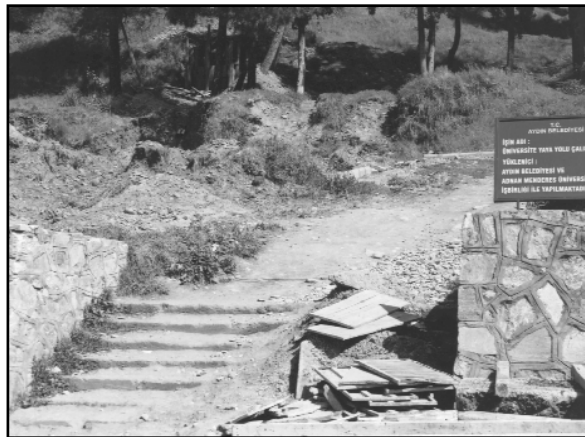
Yaya Yolunun Eski Hali

Aydın Belediyesi ile Üniversitemiz işbirliğinin ürünleri arasında bir yenisini daha eklendi. 10 Mart 2003 tarihinde yapım çalışmalarına başlanan Üniversitemiz Yaya Yolu hızla sürdürülen çalışmalar sonucunda 11 Nisan 2003'te tamamlandı.