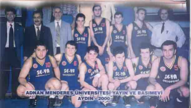
ADNAN MENDERES ÜNİVERSİTESİ YAYIN VE BASIMEVİ AYDIN - 2000